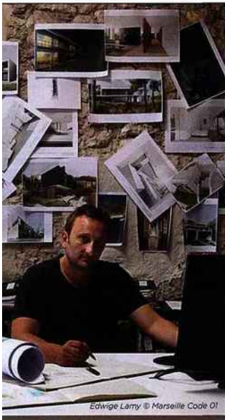
Edwige Larry © Marseille Code OI